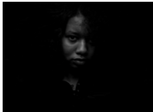
(foto från vänster till höger: Caligola: s.t.f./ Kaizers Orchestra © Paal Audestad/ Figurines: s.t.f./ Mirel Wagner © Aki Roukala)