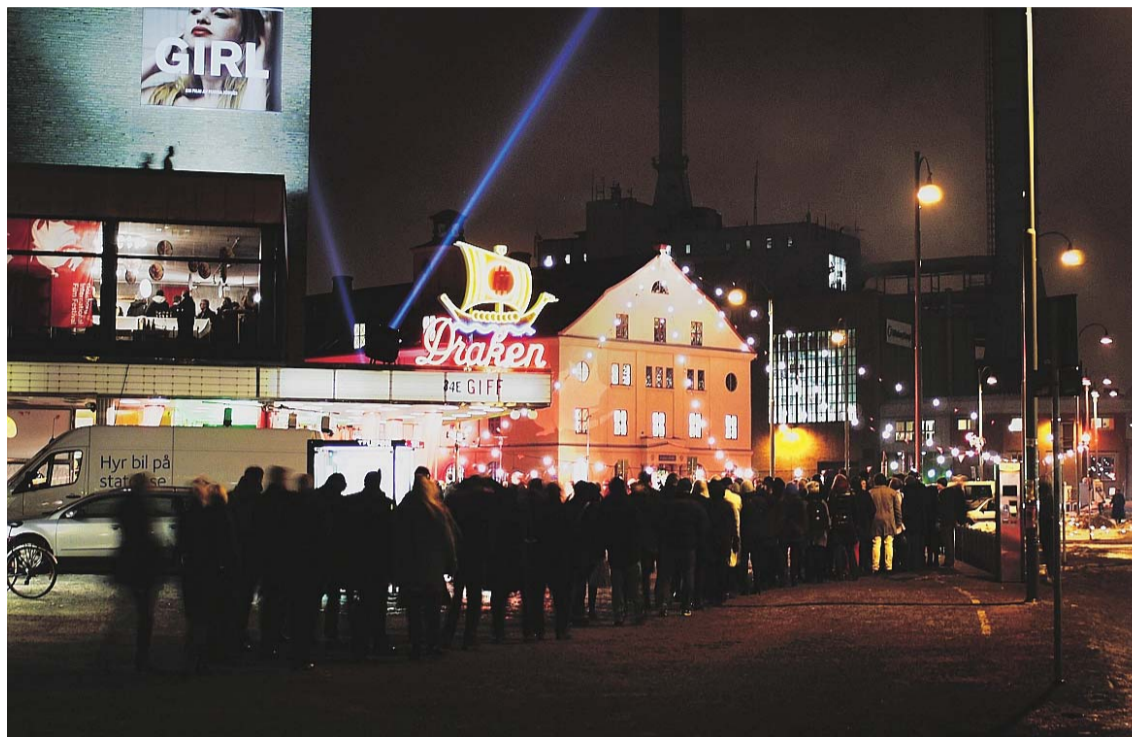
Espectadores aguardam ao frio para entrar no Draken, a maior das salas que servem o festival

Há sessões diárias, logo bem cedo de manhã. As sessões mais tardias começam às onze da noite, apenas no Draken, a sala maior ao serviço do festival. Há depois música em concertos, ao ritmo de um