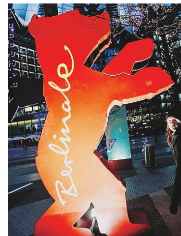
O festival começa hoje

O jornalista viajou a convite da Embaixada da Suécia