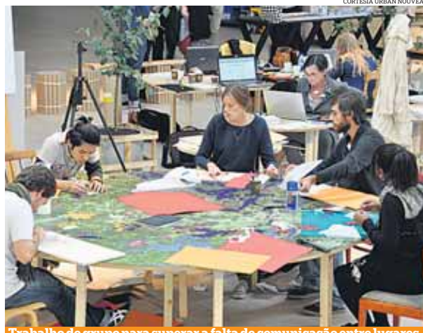
Trabalho de grupo para superar a falta de comunicação entre lugares