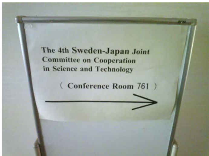
Samarbetsavtalsmöte, var så god tag till höger.